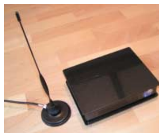
Unscheinbar, aber leistungsstark: das SBS-1 mit Magnetfußantenne.

Genau damit soll nun auch die Luftfahrt sicherer werden, denn bisher hatten nur die Fluglotsen am Boden einen Überblick über den Luftraum. Diese waren somit für die räumliche und zeitliche Staffelung aller Luftfahrzeuge alleine zuständig, was in der Vergangenheit leider nicht immer klappte. Folgeschwere Zusammenstöße von Flugzeugen in der Luft waren die Folge.